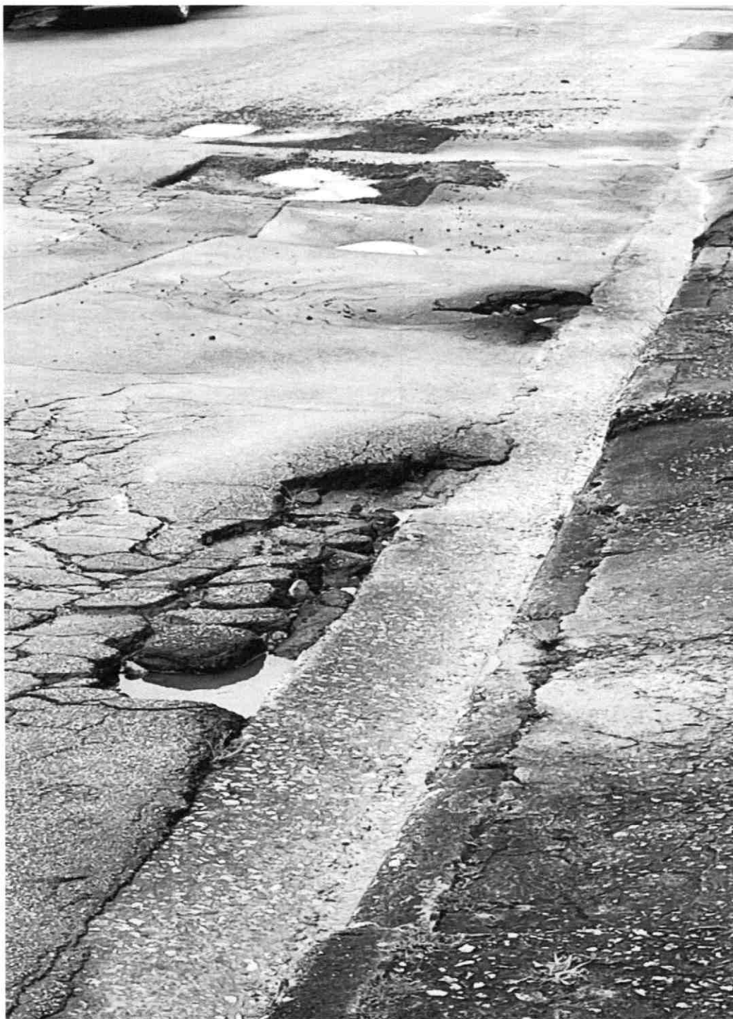
MANUTENÇÃO ASFÁLTICA EM TODA A EXTENSÃO DA RUA SEBASTIÃO BRUNI, VILA CINTRA – MOGI DAS CRUZES.